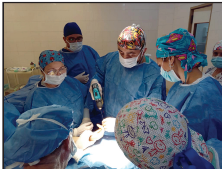
Imágenes de la cirugía compartida durante el Curso